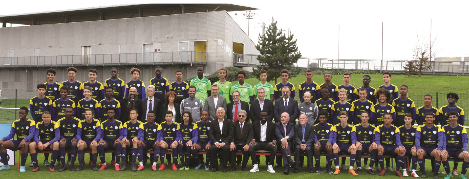
Promotion 2019/2020 de l'Académie parrainée par Blaise Matuidi

La validation du dossier scolaire est soumise aux chefs d'établissement et à la signature de la convention de formation, du règlement intérieur et de la charte interne.